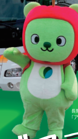
長野県PRキャラクター 「アルクマ」©長野県アルクマ